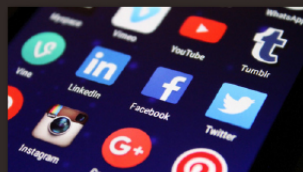
회사/제품 홍보 지원