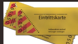
전시회 초대권 지원