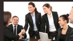
1:1 바이어매칭 지원